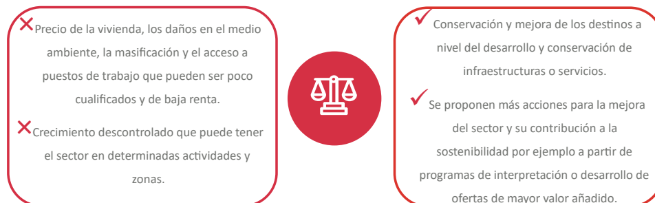
Figura 3. Pros y contras del efecto del desarrollo del turismo para los destinos