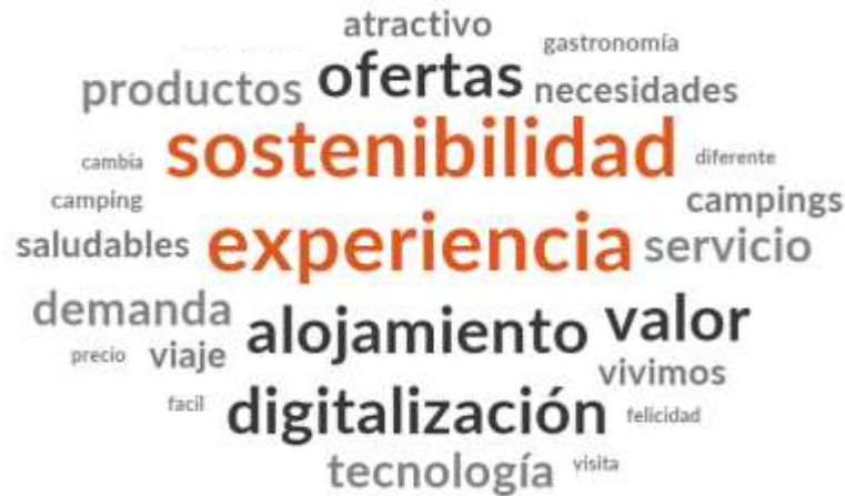
Figura 2. Nube de palabras en torno a la evolución del sector turístico

de palabras (Figura 2) a partir de la que se muestran términos clave en la evolución del sector. Destacan términos como la sostenibilidad, la experiencia, la digitalización, el valor, y el alojamiento, entre otros.